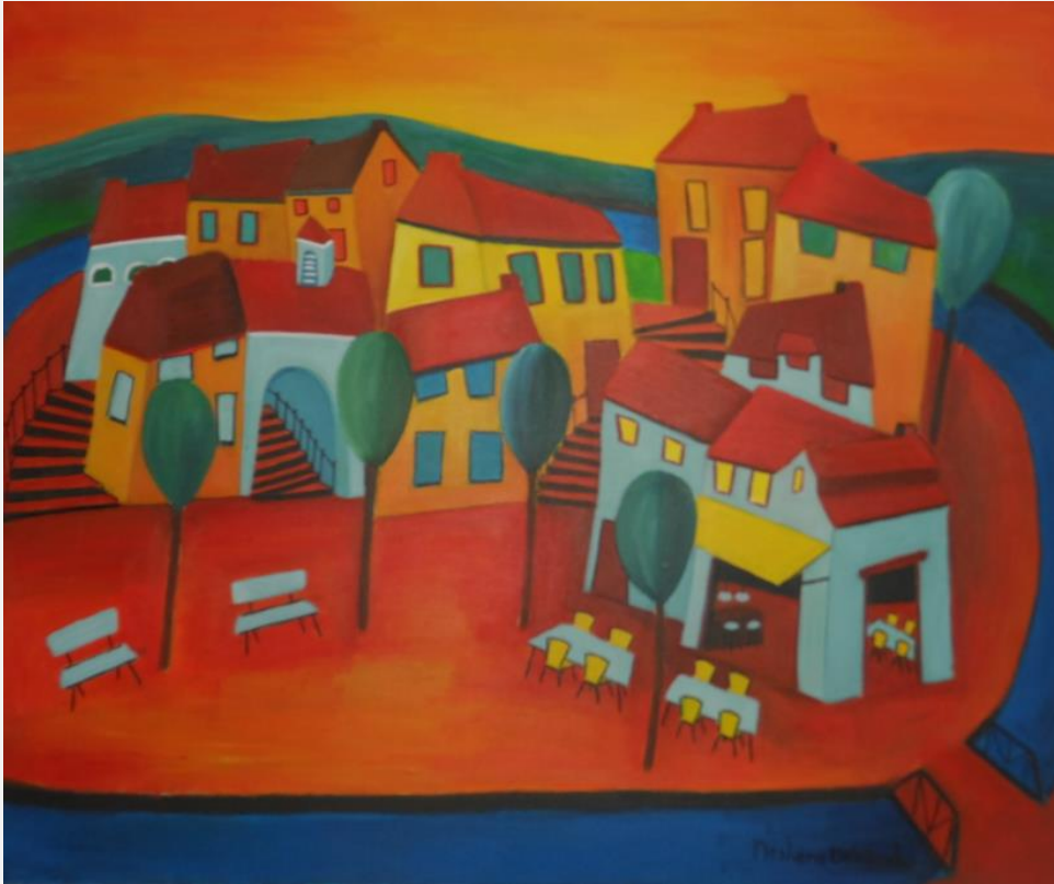
In het huis van mijn Vader zijn vele woningen I - Neshera van den Berg

Er zijn vele woningen in het ene huis. Kinderen van God hebben in het huis van de Vader een eigen woning. De apostel Paulus spreekt over deze hemelse woonstede als over een kleet: